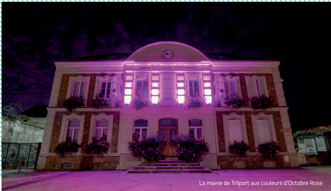
La mairie de Trilport aux couleurs d'Octobre Rose