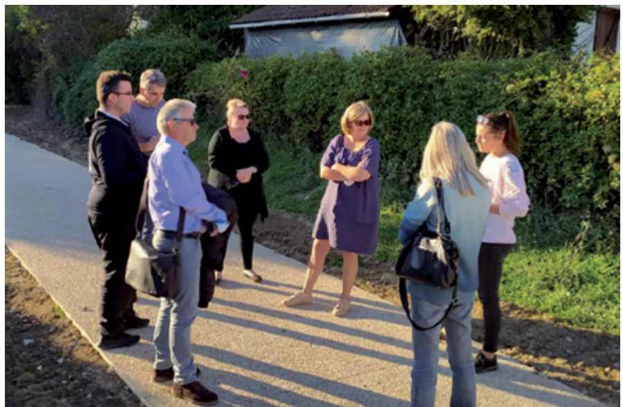
Concertation concernant le cheminement piétonnier déservant l'école de la Charmoye