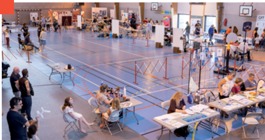
Forum des associations 2021

L'application des protocoles sanitaires étaient dans beaucoup de discussions, selon les activités ce dernier effectivement varie. Mais tous ont goûté le plaisir de se retrouver enfin après les mois de pandémie, car en matière associative, rien ne vaut le lien humain, le confinement nous l'a bien rappelé... Il faut désormais vivre avec, se protéger et protéger les autres.