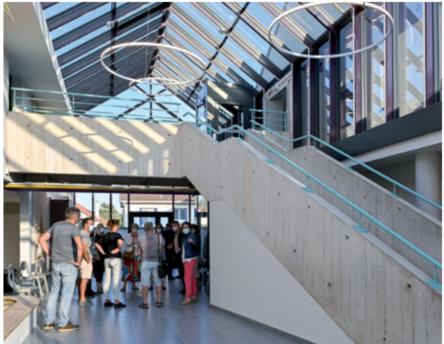
Visite des travaux réalisés cet été dans l'école Prévert