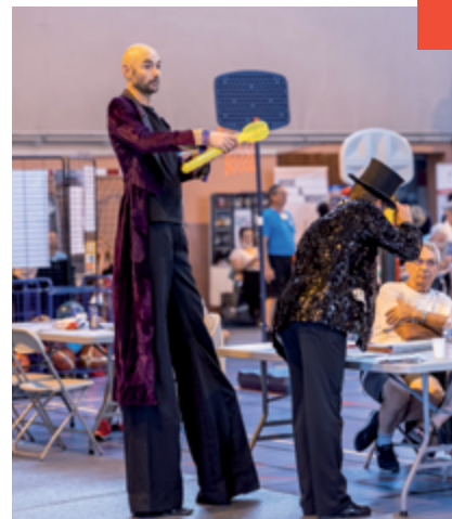
Forum des associations 2021

Une sensibilisation à la réanimation était également proposé par les pompiers du CIS de Trilport, un atelier très apprécié des participants.