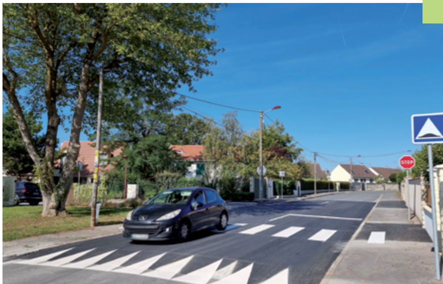
Le plateau piéton de la rue de Brinches

municipales, les élus ont proposé aux services du département de travailler sur une feuille de route destinée à déployer, en concertation, des « zone 30 » pour limiter les nuisances des riverains en luttant contre la vitesse excessive, sécurisant les mobilités douces et actives, rénovant des voies dont la dégradation devient préoccupante.