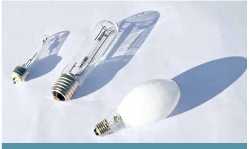
Lampes d'éclairage public : lampe iodure céramique (nouvelle génération), lampe tubulaire à vapeur de sodium (en place actuellement), lampe à vapeur de mercure (ancienne génération).

des lampes. Ce système est basé sur une liaison par courant porteur en ligne (CPL). Cette télégestion permettra de contrôler individuellement et à distance tous les lampadaires de la commune, de détecter le dysfonctionnement éventuel d'une lampe, tout en effectuant le suivi global de l'éclairage urbain.